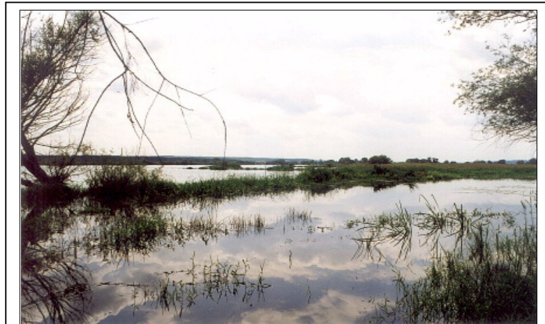
Auenlandschaft an der Oder bei Schwedt/Brandenburg