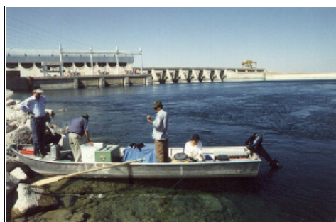
Fischereibiologische Untersuchungen am mittleren Euphrat

Das Syrisch-Deutsche TZ-Vorhaben "Fischerei- und Aquakulturentwicklung im syrischen Binnenland (IFAP)" soll die syrischen Partner, die Fischereiabteilung im Ministerium für